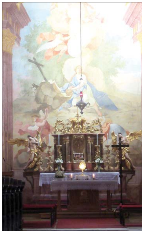
Az Oltáriszentség az egész napos szentségimádás során

Áldozat nélkül nincs eredmény. Jézus is megmutatta. Legvégsőig elment, mert nem az a szegény, akinek egy fillérje sincs, hanem az, akinek egyetlen álma sincs. Énnekem van egy álmom, hogy át tudom adni az örömhírt, de erre nem én vagyok a garancia, hanem a gazdám. Ámen.