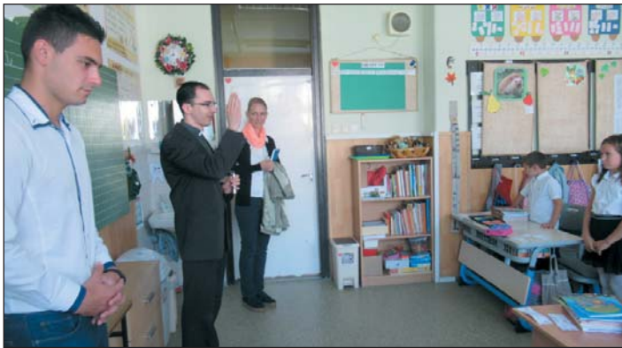
Balázs atya megáldja a diákokat a tanév elején

kell ismernem, de az elkövetkezendő hetekben, hónapokban ez folyamatosan történik. Örülök a kedves fogadtatásnak, a hívek szeretetének, jó szándékának, és ezzel a lelkiülettel megyek az előttem álló úton tovább.