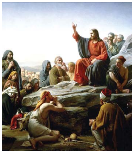
Karl Heinrich Bloch: Hegyi beszéd