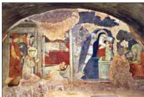
A Greccio-i barlangkápolna freskója, 1409

Minden keresztény ünnepünk alkalmával egyet ünneplünk: Istentől szeretett és megváltott emberek vagyunk. Benne nincs semmi változás, Ő állandó jelen, ezért a szeretete és megváltottságunk is változatlan. Ennek tudatában éljünk, ez legyen a bennünket és cselekedeteinket irányító emberi magatartásunk. Az ezért való hálánk töltsse ki mindennapjainkat és boldogabb lesz az életünk. Így kívánok minden kedves Krisztushívőnek áldott karácsonyi ünnepet, és sok lehetőséget a jóra az új évben!