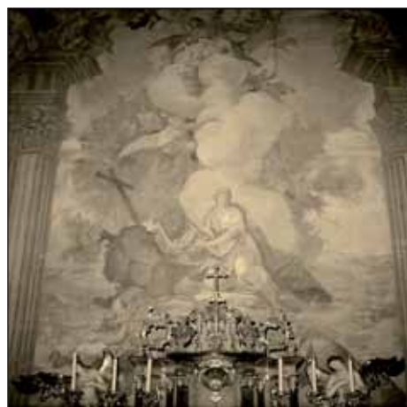
Főoltár 1986

Nem tudjuk, hogy a nagytemplom freskóinak megrendelésekor Koller Ignác veszprémi püspök mennyire részletekbe menően határozta meg a falképek által képviselt spirituális, avagy lelkipásztori programot, mennyire kötötte meg a festő kezét ez a program. Általános szokás volt, hogy a témát/témákat a megrendelő, az ábrázolás módját inkább a tervező-festő adta meg. A sziléziai születésű Johann Ignaz Cimbal jőnevű templomfestő volt, bár nem érte el Maulbertsch vagy a Dorffmaister-terek színvonalát.