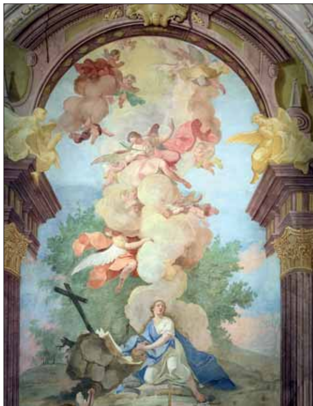
Főoltár 2020