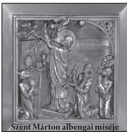
Szent Márton albengai miséje