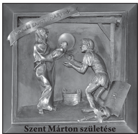
Szent Márton születése

A komoly súlyú kapu használatát nagyban segíti a méretezett pántokon túl a pántok tengelyében a burkolaton elhelyezett kúpos persely, ami a kapu nyitását segíti elő.