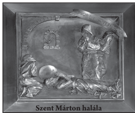
Szent Márton halála

Hálát adunk Neked Urunk testvérünkért, egyházközségünk hűséges tagjáért,