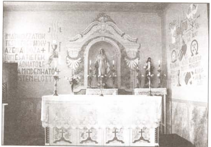
A ságodi kápolna

1997. évben a Településrészi Önkormányzat célul tűzte ki a volt iskola épület karbantartását és felújítását. Ebben az épületrészben található a Kápolna is. Itt havonta egyszer szentmisét tartanak, a többi vasárnap igeliturgia van. A Zalaegerszeg Megyei Jogú Város Polgármesteri Hivatala Közgyűlése biztosította a településrész számára az 1997. évi költségvetésben megatározott 350 ezer Ft-ot. 1997. évben megalakult a "Ságodért Alapítvány", helyi szerveződéssel. Céljai közt szintén szerepelt a volt iskola felújítása. Pályázat útján 300 ezer Ft-ot sikerült e célra kapni a ZMJ Várostól. A Kápolna és a volt iskola felújítása 1997. július – augusztus – szeptember hónapban zajlott. Csak két igeliturgia nem került megtartásra a munkálatok miatt. A munkálatok között tetőjavítás, elektromosáram felújítás és festés szerepelt. A festési munkát helyi vállalkozóval sikerült megoldani, aki a kápolna oltárképét az eredeti állapot szerint újjította fel. A helyi lakosság is támogatta adományokkal a kiadásokat, valamint a takarítási munkákban részt vettek.