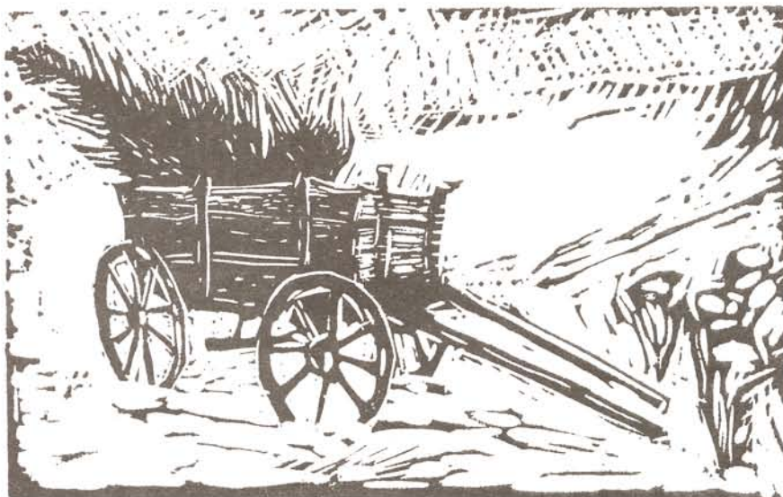
Budaházi Tibor linómetszete

Mit akar ez a drága vendég? Nézd, milyen alázatosan vár, pedig Ő a királyok királya. Nézd, milyen szelid, pedig Ő a legfőbb Bíró. Nézd, milyen sugárzóan szép és dicsőségében mosolygó, pedig Ő a fájdalmak embere és a Kereszt nagy szenvedője. Régi, örök, legjobb ismerősöd és barátod. Ha nem tudtad is, mindig Őt vártad. Ha nem mondtad is, életednek ez a legnagyobb alkalmá és a legboldogabb perce. Tárd fel azaz ajtót, és köszöntsd Őt, elibe borulván: Áldott, aki jött az Úrnak nevében!