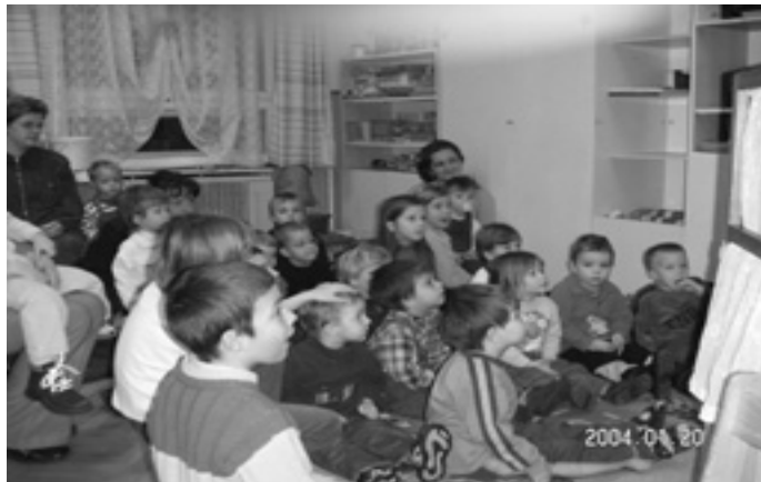
A Szent Család Óvoda nagycsoportosai báboznak a nyílt napon a jövődöbéli óvodásoknak.