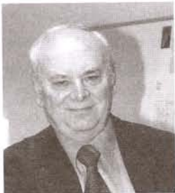
Portisch Lajos Olimpiai bajnok sakkozó

Jézus Krisztus tiszta forrás, példát és erőt ad a legnagyobb megpróbáltatásban is. Kigúnyolták, megalázták: Ecce Homo. Íme az ember. De ő imádkozott a megbocsátásért, mert nem tudják, mit cselekszenek. Így emelkedett felül és mutatott példát a világnak. Jézus örök világosság az emberiség sötét korszakaiban is. Követni kell, figyelni Rá!