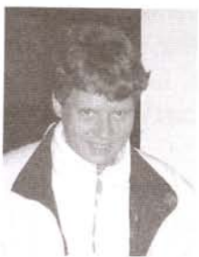
Bérces Edit világbajnok hosszútávfutó

Mi is ünnepeljük a karácsonyt, mint a legjobb keresztény családoknál. Azt is elmondhatom, hogy talán jobban megünnepeltem a keresztény ünnepeket, mint a sajátos muszlim ünnepeket. Végül jókívánságaimat fejezem ki a közösségük tagjainak, a város és a megye lakóinak. Bízom, hogy az emberek még szorosabban egymás mellett tudnak állni.