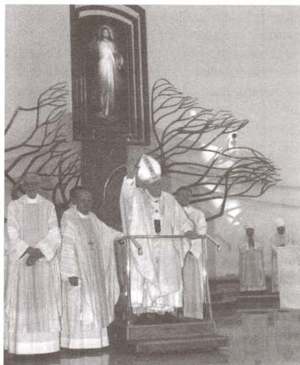
II. János Pál pápa az Isteni Irgalmasság bazilika felszentelésén.

Elsőáldozásokat ünnepét (vagy más jeles eseményt is) emlékeztetéssé tehetek egy rózsátó elültetésével.