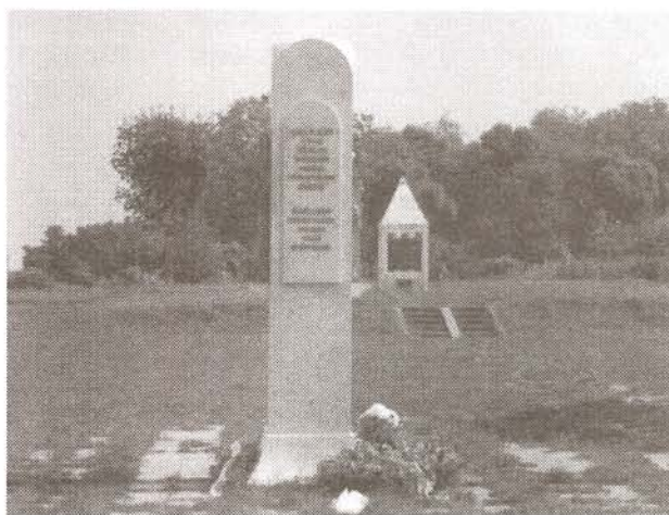
A Ciril és Metód emlékmű

A magyar államalapítást követően Szent István király bencés monostort építtetett Zalaváron 1019-ben szintén Szent Adorján tiszteletére. Később itt épült fel a megye központját jelentő ispáni vár. Ennek az időnek az emlékét őrzi az a kápolna, melyet a középkori település plébániatemplomának alapjain, a román stílus jegyeit követve, építettek fel.