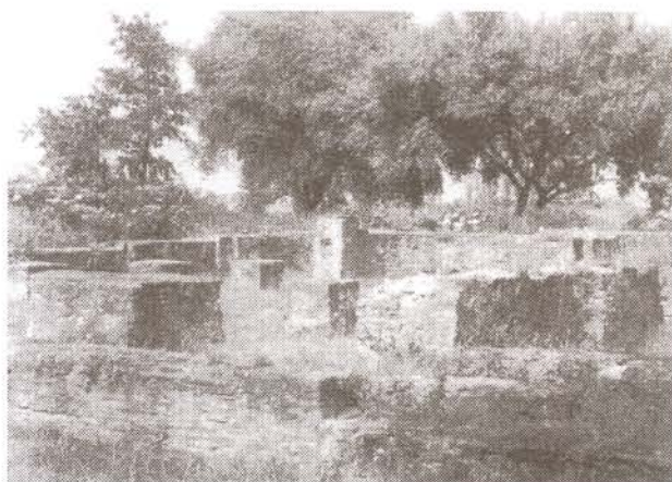
A háromhajós bazilika alapjai

Szent László idejétől Zalavár viselte ezt a rangot a megye első településeként. A ma szerény falucska így gazdag múlttal dicsekedhet, és egykor ehhez méltó építészeti emlékekben volt gazdag, amit ma már csak a régészek ásója igazol. Ezek eredményeivel igényes kiállításon ismerkedhet a látogató a helyszínen felépített modern múzeum épületben.