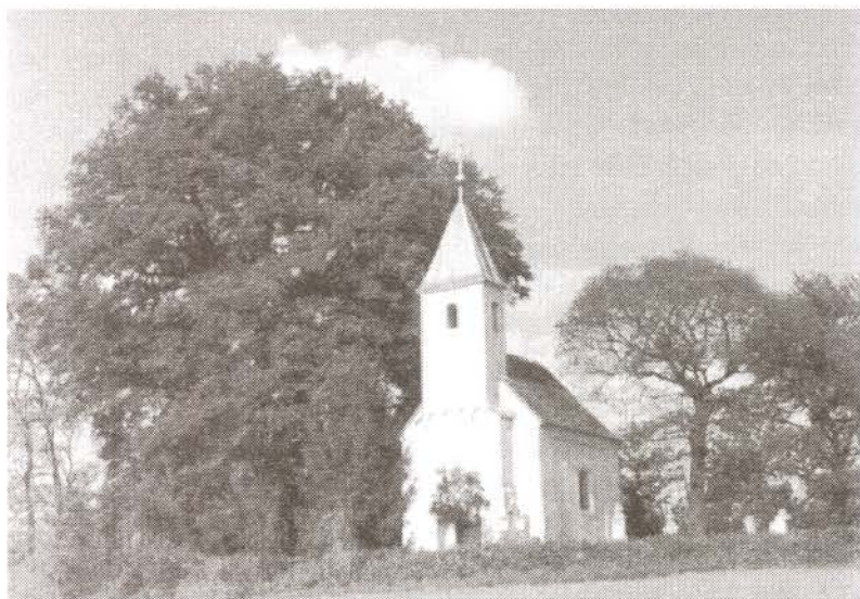
Szent Ilona kápolna

A tőle nem messze található Szent Ilona kápolna a középkori Dobron falu temploma volt. A falu szintén a török-kor utáni újjáéledéskor települt jócskán távolabb a templomtól. Felépülését a XIII. század közepére teszik, első írásos említése 1366-ból való. Védőszentje ekkor Szent Miklós volt. A hódoltság idején romossá vált épületet a barokk kori felújítás jelentősen átalakította. Ekkor lett védőszentje Szent Ilona, Nagy Konstantin császár édesanyja, Krisztus keresztjének