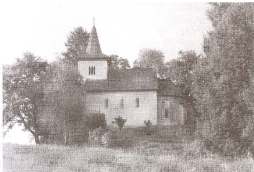
Szent Mihály templom

Pontosabban a dombok peremén, hiszen Göcsej dimbes-dombos, göcsös-göcsörtös vidéke itt kezdődik. A két téglatemplom, melyekről szó lesz, a Zalaegerszegtől délnyugatra eső tájegység legrégebbi építészeti emlékei.