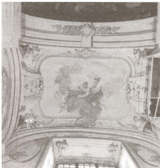
Kórus freskó restaurálás után