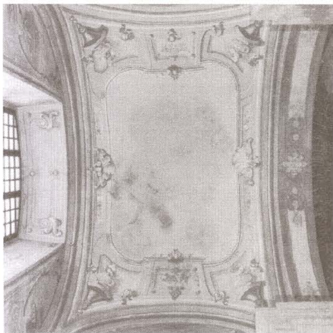
Kórus freskó restaurálás előtt