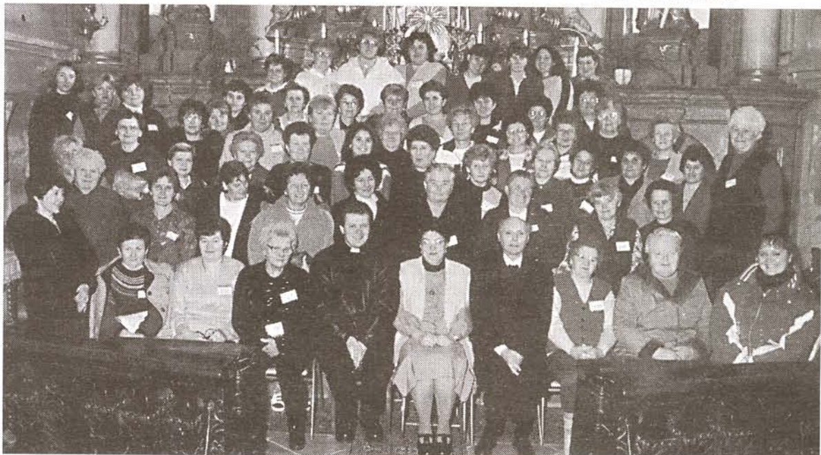
Cursillo 1998. novemberében