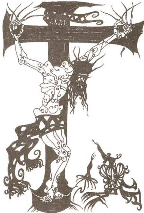
Illusztráció: NÉMETH MIKLÓS

"A kereszt útján, gyermekeim, csak az első lépés nehéz. Legnagyobb keresztünk nem maga a kereszt, hanem az, hogy félünk tőle. Nincs meg a bátorságunk, hogy hordozzuk, jóllehet tudjuk s tapasztaljuk, hogy kikerülni nem lehetséges: utolér bennünket."