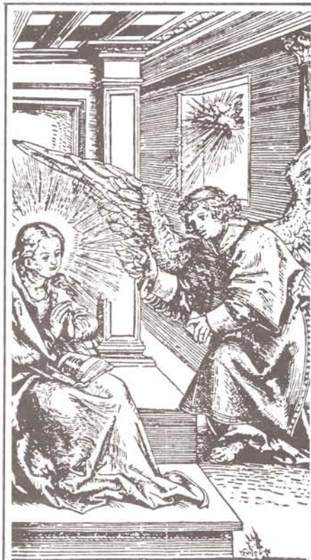
Id. Lucas Cranach: Angyali üdvözlet